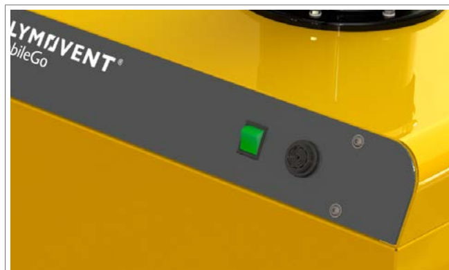
Enkel kontroll | Serviceindikator (summer) övervakar luftflödet